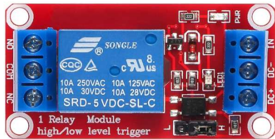
1CH リレーモジュール SRD-5VDC-SL-C